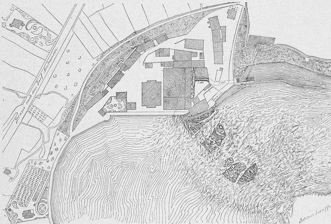
Fig. 1. Lageplan. — Masstab 1 : 2600.

wendungen der Elektrizität haben denn auch trotz des im Lande bestehenden Mangels an Rohstoffen eine Fülle neuer Industrien hervorgebracht. Eine der ersten darunter hatte zum Zwecke, die Erfolge, welche Männer wie Davy, Bunsen, Deville und Wöhler in ihren Laboratorien erzielt hatten, in das Bereich der industriellen Wirklichkeit überzuführen, indem in der Schweiz die erste Aluminium-Fabrik des Kontinents entstand, nämlich in Neuhausen am Rheinfall. *)