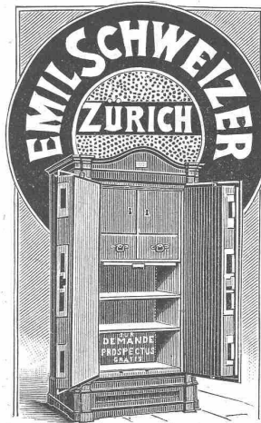
vormals Cosulich-Sitterding gegründet 1840.

Kägi & Reydellet in Winterthur. (M 5095 Z.)