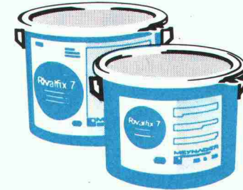
Farbanstriche auf Gussasphalt