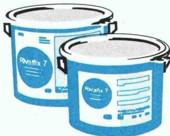
Dekontfähige Bodenversiegelungen in Kernkraftwerken