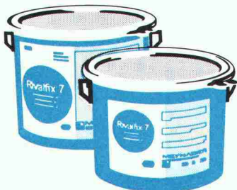
Ölbeständige Tankwannen nach Anhang 7 TTV