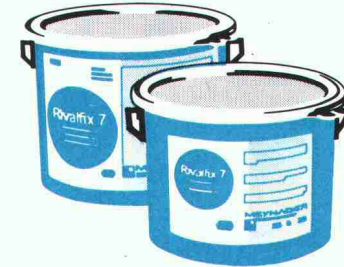
Farbanstriche auf Gussasphalt