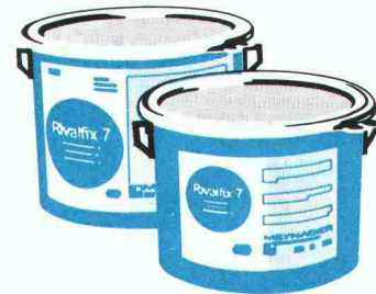
Schutzanstriche für Kläranlagen, Tunnels, Stollen