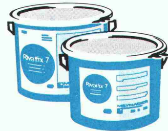
Schutzanstriche für Kläranlagen, Tunnels, Stollen