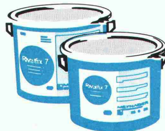
Tausalzbeständige Strassen- und Brückenborde