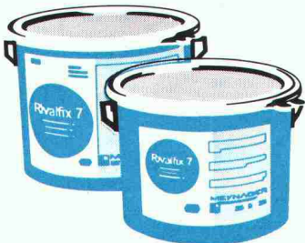
Staubfreie Böden wo immer benötigt