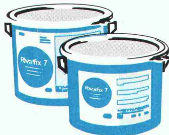
Dekontfähige Bodenversiegelungen in Kernkraftwerken