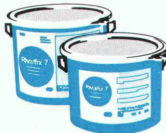
Tausalzbeständige Strassen- und Brückenborde