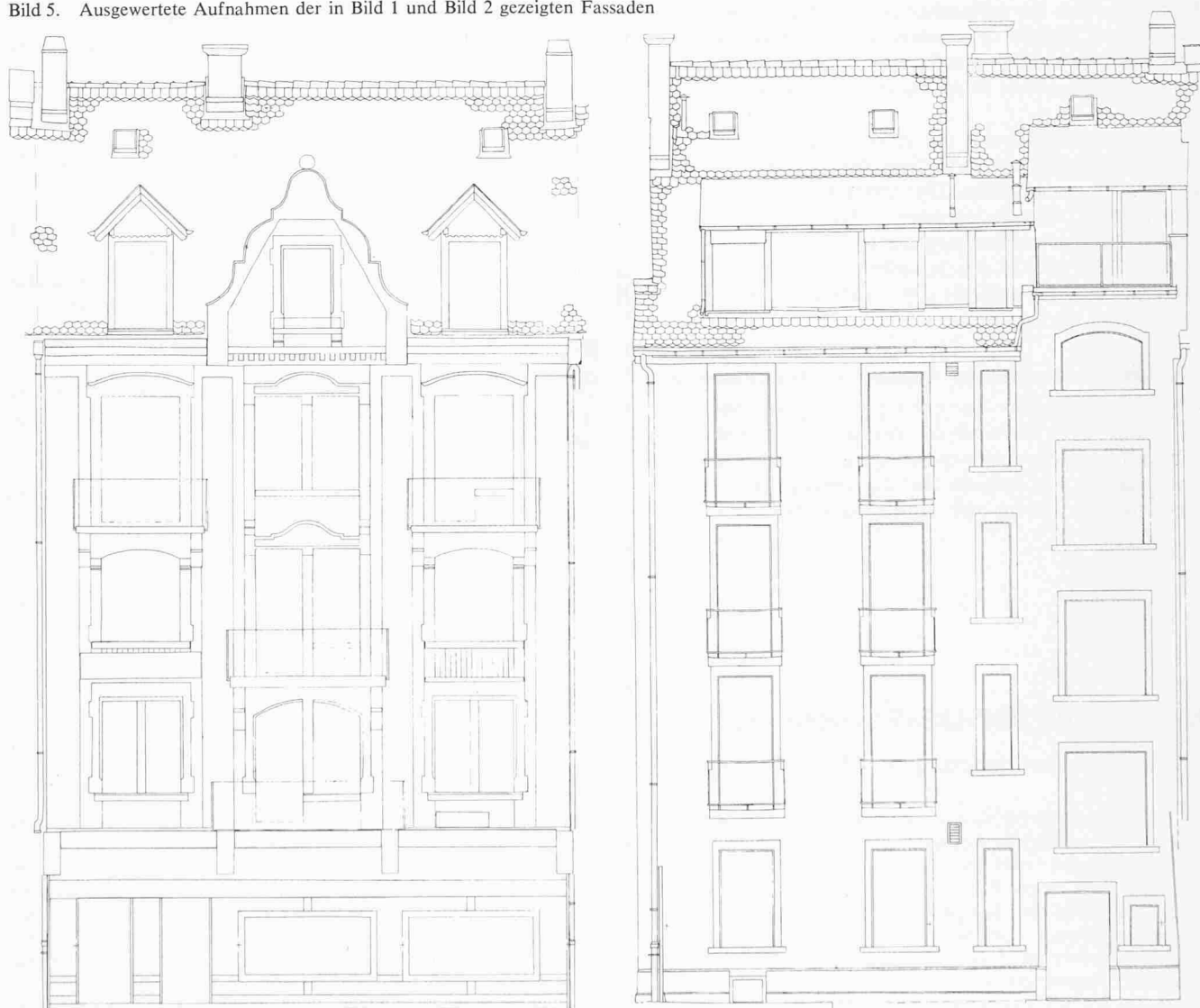
Bild 5. Ausgewertete Aufnahmen der in Bild 1 und Bild 2 gezeigten Fassaden