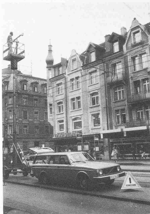
Bild 4. Hebebühne (rechts). Von ihr aus lassen sich verhältnismässig bequem Aufnahmen machen