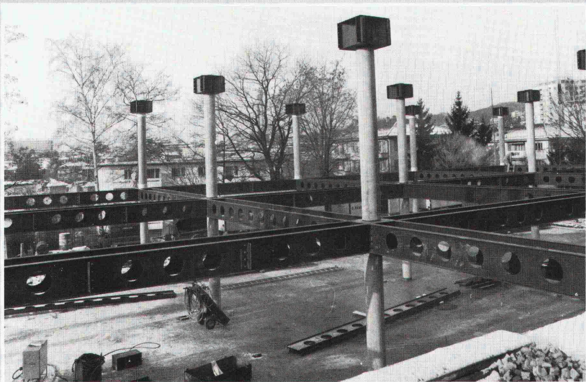
Ecole nouvelle de la Suisse romande, Chailly. Architekt: Réalisations scolaires et sportives, Lausanne Ingenieur: Techn. Büro PIGUET, Ing. conseils, Lausanne

Herausgeber: Verlags-AG der akademischen technischen Vereine