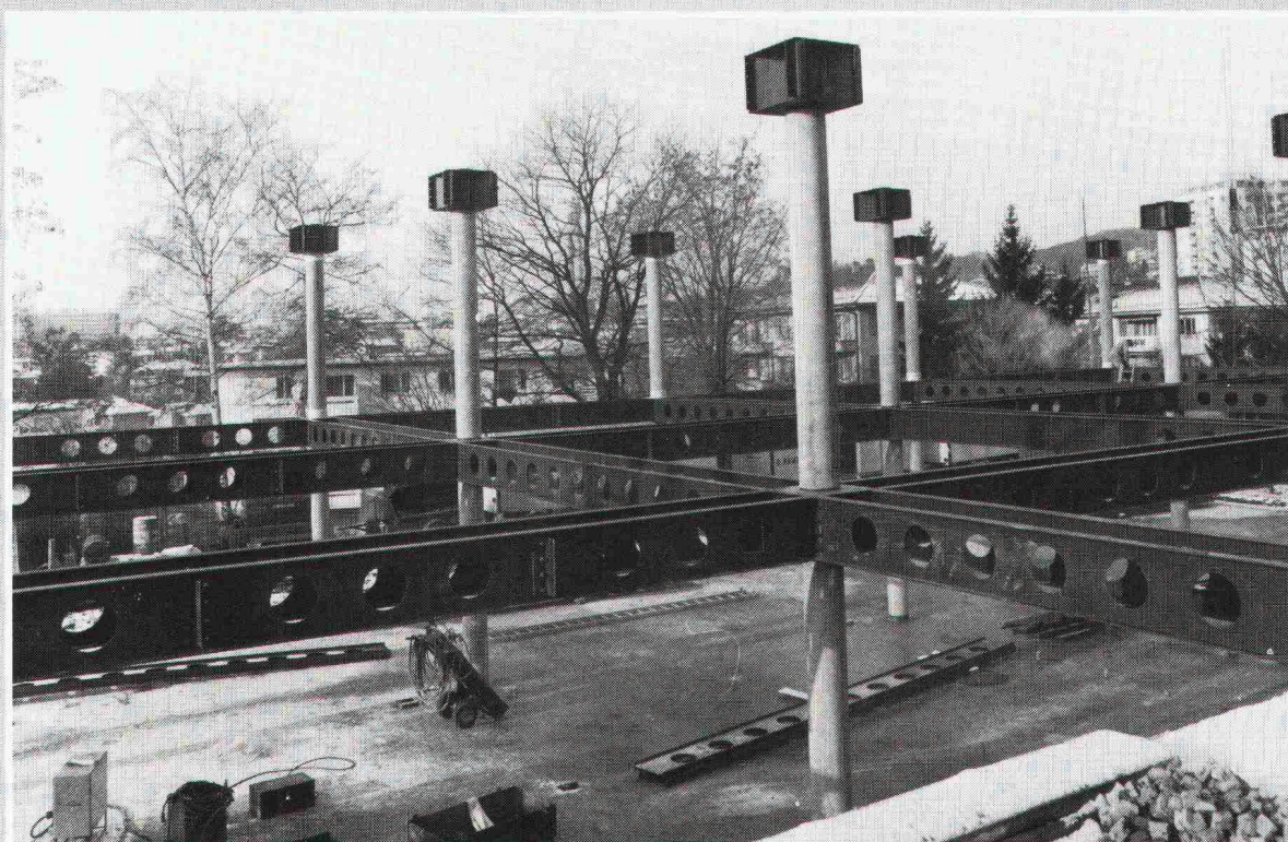
Ecole nouvelle de la Suisse romande, Chailly. Architect: Réalisations scolaires et sportives, Lausanne Ingenieur: Techn. Büro PIGUET, Ing. conseils, Lausanne

Herausgeber: Verlags-AG der akademischen technischen Vereine