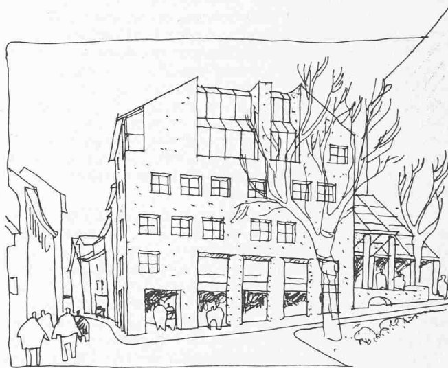
Ansicht von der Rämistrasse