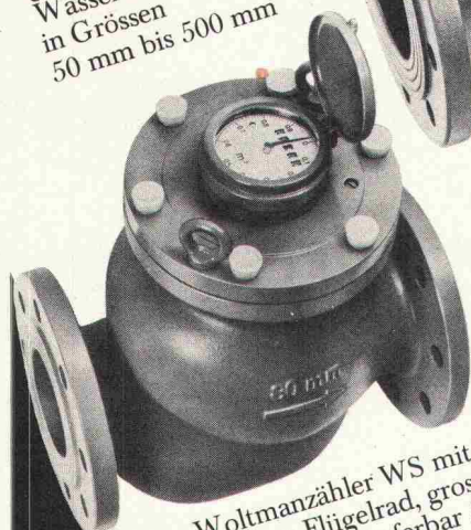
Woltmanzähler WS mit senk- recht Flügelrad, grosser Messbereich, lieferbar 50 bis 150 mm