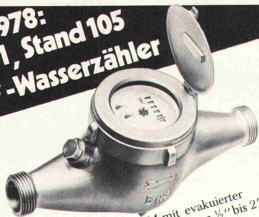
Kaltwasserzähler MTRM mit evakuierter Zählwerkdose, lieferbar in Grössen ½" bis 2"

Hilsa 1978: Halle 1, Stand 105 GWF-Wasserzähler