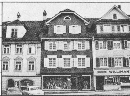
Karteiblatt zur Methode der Denkmalpflege (Seite 116). In Bildmitte das Wohn- und Geschäftshaus der Tuchhandlung Lüthi

BESCHREIBUNG 3-gesch. verputzter Massiv/Fachwerkbau über Rechteckgrundriss, schmal-seitig zum Flecken. Gleichflüchtig zwischen den Nachbarbauten. Gemeinsame Trauf- und Firstlinie mit Nr. 237, jedoch versetzt gegenüber Nr. 239. Fassade (N): Hochrechteckiges unauffälliges Zeilenelement. 3 regelmässig gereichte Fensterachsen in den OG, modernistischer störender Ladeneinbau, von den OG durch breites Vordach getrennt. Massige 2-achsige Giebelgauben mit Krüppelwalmen. An Rückseite 2-gesch., geschosswise abgetreppter Flachdachvorbau, der 2 Drittel der Hausbreite einnimmt. Garten mit plattengedeckter Stützmauer zur Gerbergasse. Bedeutend als Glied der geschlossenen Häuserzeile.