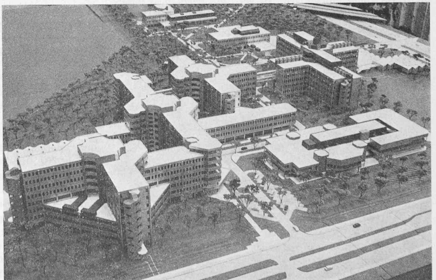
Modellansicht der Neubauten im Stadtteil Perlach (München). Planung: Siemens-Bauabteilung. In beratender Funktion wurde das Büro Van den Broek und Bakema (Niederlande) beigezogen

Alle Gebäude sind an eine gemeinsame Ringstrasse und eine unterirdische Versorgungsstrasse angeschlossen. Auf der Nordseite ist ein Parkplatz für 1500 Wagen vorgesehen. Im Süden des Geländes soll 1978 eine S-Bahn-Haltestelle eingerichtet werden und ab 1980 die U-Bahn verkehren. Unter dem Einfluss der Energieverteuerung der letzten Jahre erhalten die Fassaden und Dächer eine intensive Wärmedämmung. Der Fensteranteil aller Bauten ist kleiner, als bisher üblich, und das Lüftungskonzept sieht vor, die Beleuchtungswärme zu Heizzwecken wiederzuverwenden. Obwohl die Räume künstlich be- und entlüftet werden, lassen sich überall die Fenster öffnen. Ausgenommen davon