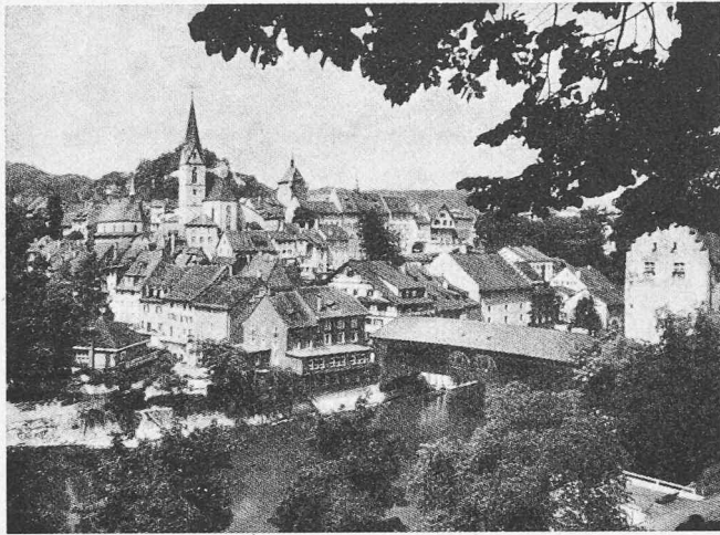
Baden. Altstadt von Südosten, mit Sebastianskapelle, Stadtkirche, Bruggerturm, Rathaus, ehemaligem Kornhaus, Holzbrücke und ehemaligem Landvogteischloss (Bild 48)