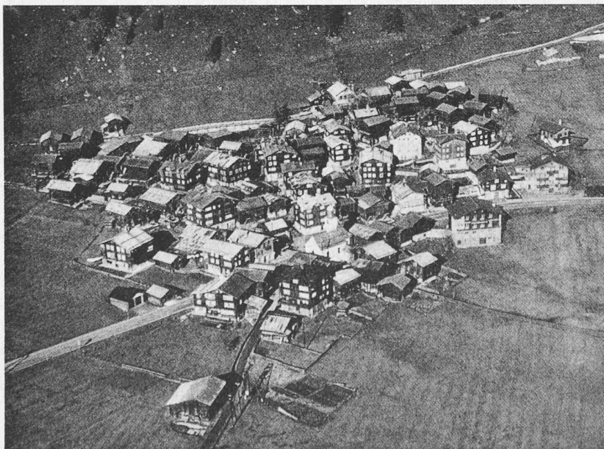
Geschinen. Das geschlossene Haufendorf schmiegt sich in den Zwickel, den der nördliche Talhang mit der östlichen Flanke des Münstiger Aufschüttungskegels bildet. Geschinen ist mit seinen stattlichen «Vorschutz»-Häusern und Stadeln unter die wertvollsten Siedlungen des Goms einzureihen, um so mehr, als es noch wenig störende Eingriffe erfahren musste (Bild 192)

Holzhaus in Ernen sein Gegner und Nachfolger, der Jerg Uf der Flühe hiess, bevor er sich zu Georgius Supersaxo latinisierte.