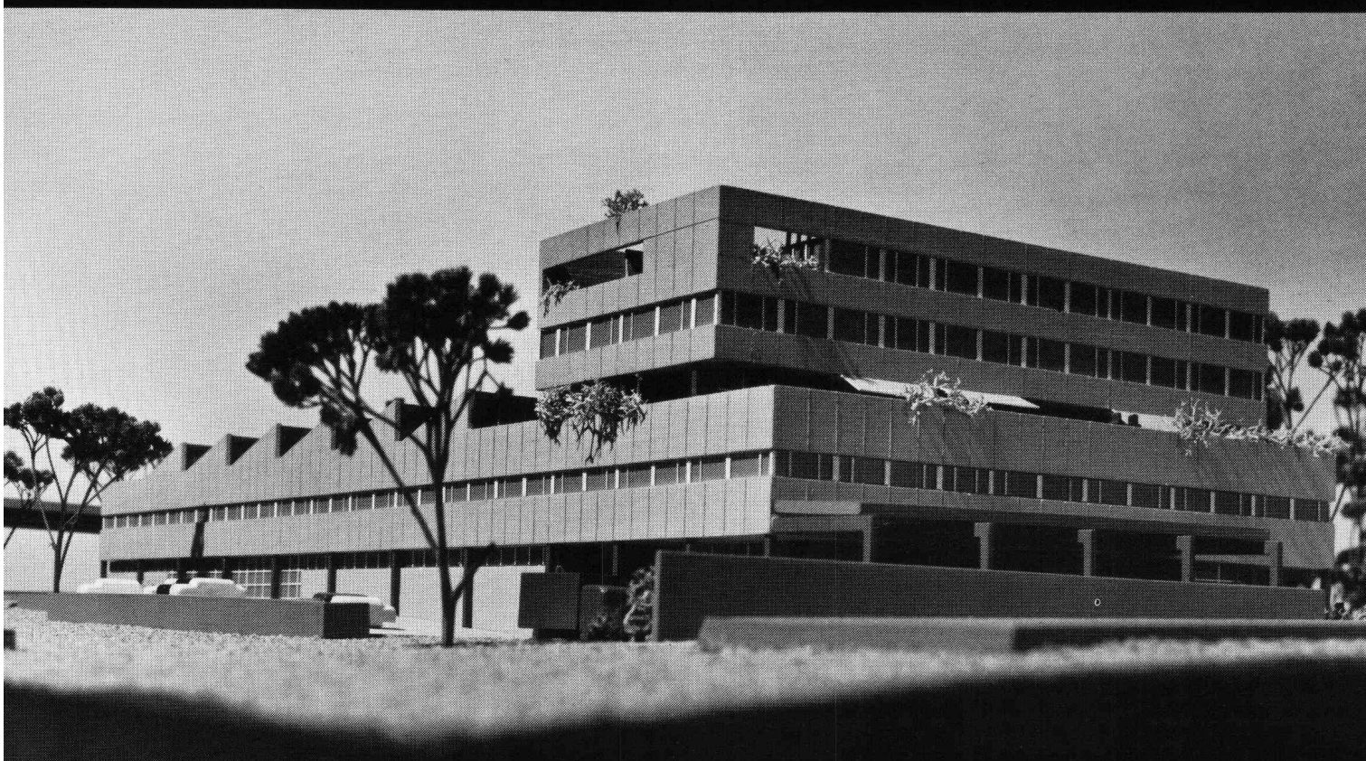
Zentralwäscherei Bern Architekten BSA/SIA Itten und Brechbühl, Bern

Die Zentralwäscherei Bern wird täglich bis 30 Tonnen Schmutzwäsche von Spitälern der Region des Kantons Bern reinigen.