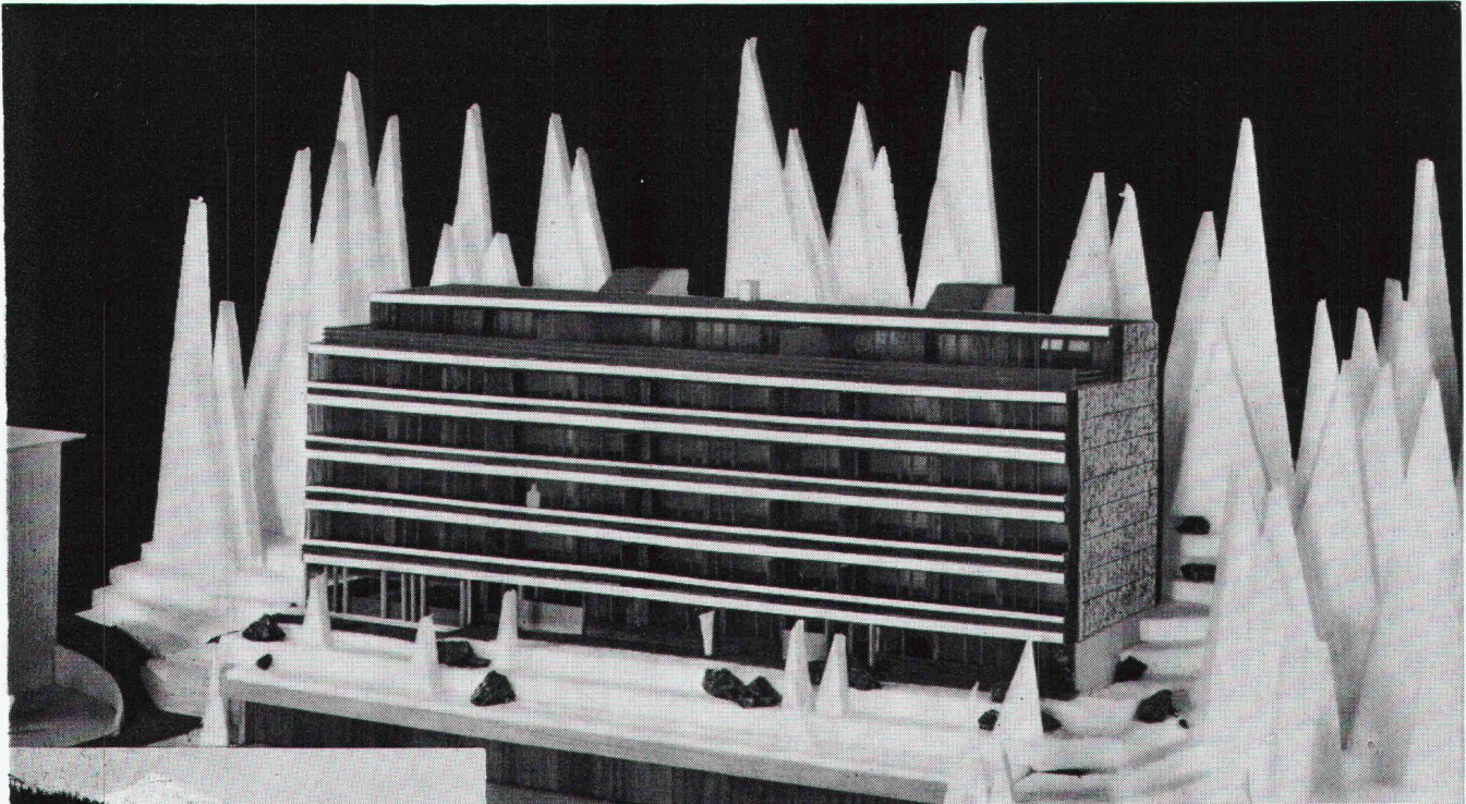
Überbauung Meiliboda 2, Elektrizitätswerk Arosa; total 30 Wohnungen; Anschlusswert ca. 380 kW

Herausgegeben von der Verlags-AG der akademischen technischen Vereine, Zürich