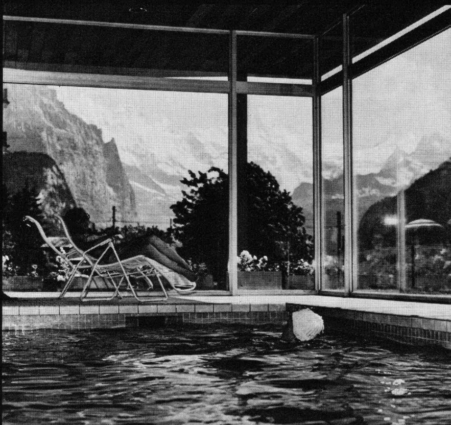
Bild oben: Hallenbad der Gemeinde Lenk Architekten R. Friedli und A. Sulzer, Bern, dipl. Arch. SIA Bild unten: Hallenbad Hotel Metropole in Wengen Architekt Walter Gross, Wengen