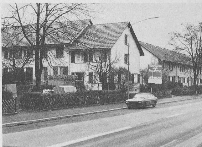
Siedlung «Sunnige Hof» in Zürich

Im Auftrag der Siedlungsgenossenschaft «Sunnige Hof» begann die Unirenova AG, Zürich, Mitte September mit der Renovation der vor 30 Jahren erstellten Siedlung an der Dübendorfstrasse in Zürich-Schwamendingen. Dabei werden 37 Einfamilienhäuser und 78 Wohnungen auf eine den heutigen Anforderungen entsprechende Komfortstufe gebracht. Dazu gehört die Installation einer Zentralheizung, verbunden mit einer neuen Warmwasseraufbereitung. Gleichzeitig werden alle Einfamilienhäuser und Wohnungen mit modernen Küchen und Bädern ausgerüstet. Die alten Fenster werden durch neue doppelverglaste ersetzt – entlang der stark befahrenen Dübendorfstrasse (auf unserem Bild im Vordergrund) in schalldämmender Ausführung. Bis Mai 1976 werden die Arbeiten, für welche die Unirenova Garantien für Preis, Termin und Qualität übernimmt, abgeschlossen sein.