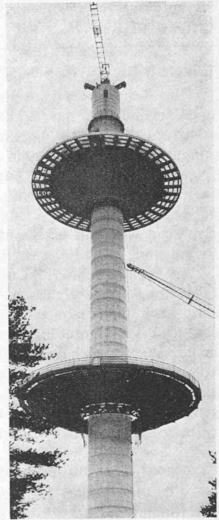
Bild 3 (rechts). Fernmeldeturm Wesendorf (FMT 14; 1970/71) während des Baus; 94 m hoher Schaft aus Kletterschalungs-beton mit einer Kanzel und drei Plattformen.

und 2/73 mit 200 m 2 grossem antennennahem Betriebsraum und für kleine Funkübertragungsstellen ohne hochliegenden Betriebsraum als Antennenträger die Fernmeldetürme FMT 8 bis 10/73, die nicht nur in Ortbeton, sondern auch in Fertigteilbauweise ausgeführt werden, und ab 1975 als Neuentwicklung die Fernmeldetürme FMT 11 bis 13/74 mit 100 m 2 grossem antennennahem, hochliegendem Betriebsraum, zwei Richtfunkantennen-Plattformen und einem Schleuderbetonmast oberhalb des Turmkopfes für verschiedene UKW-Dienste. Nur noch diese Türme sollen jetzt gebaut werden. Bei den drei Gruppen von Fernmeldetypentürmen sind die Leistungsverzeichnisse EDV-gerecht nach StLB aufgestellt und bei der Planung die Neuauflagen der DIN 1045, 276 und 277 berücksichtigt. Einige besondere Planungs- und Konstruktionsmerkmale für Fundamente (Kreis- oder Mehreckplatte), Schäfte (Kreiszyylinder oder konisch; Kletter- oder Gleitschalungsbeton; Fertigteile), Kanzeln (Hubschale, Fertigteile) und Antennenmaste (Stahl, Fertigteile, Schleuderbetonmaste) sowie Einzelheiten über Abmessungen, Bewehrung, Belastungen usw. sind Tabelle 1 zu entnehmen. Beim Turmbau wird man die Fundamente spätestens im Winter beginnen, um mit dem Turmschaft sowie Kanzel und Plattform bis Jahresende fertig zu werden.