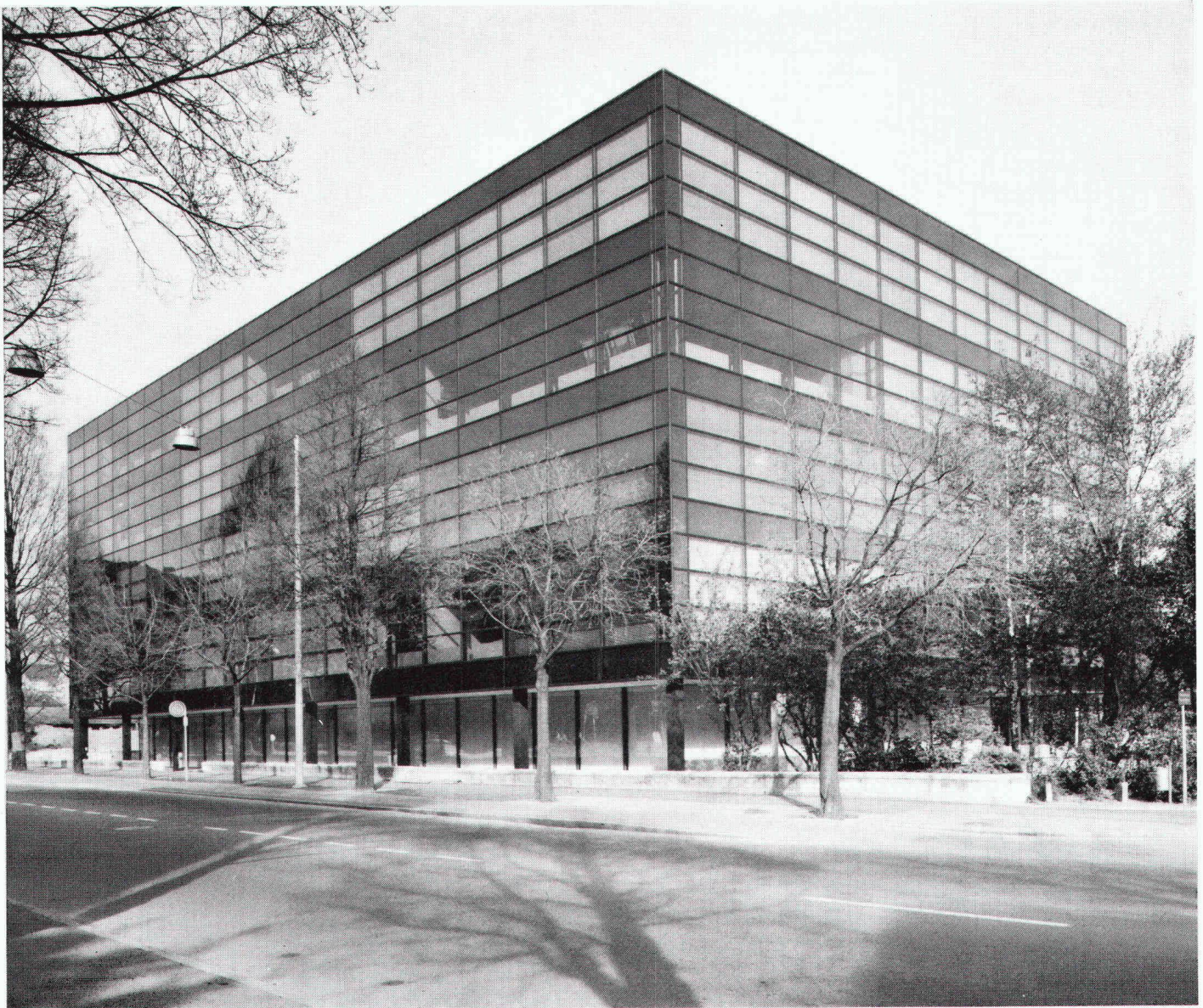
Neubau der Gewerbeschule Biel

Verlags-AG der akademischen technischen Vereine