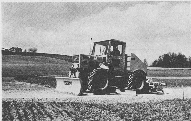
Die MBB 5 = 1 mit Grobplanierschild, Feinplanierschild und Plattenverdichter beim Bau einer Gemeindefrasse

Marcel Boschung, Maschinenfabrik, 3185 Schmitzen