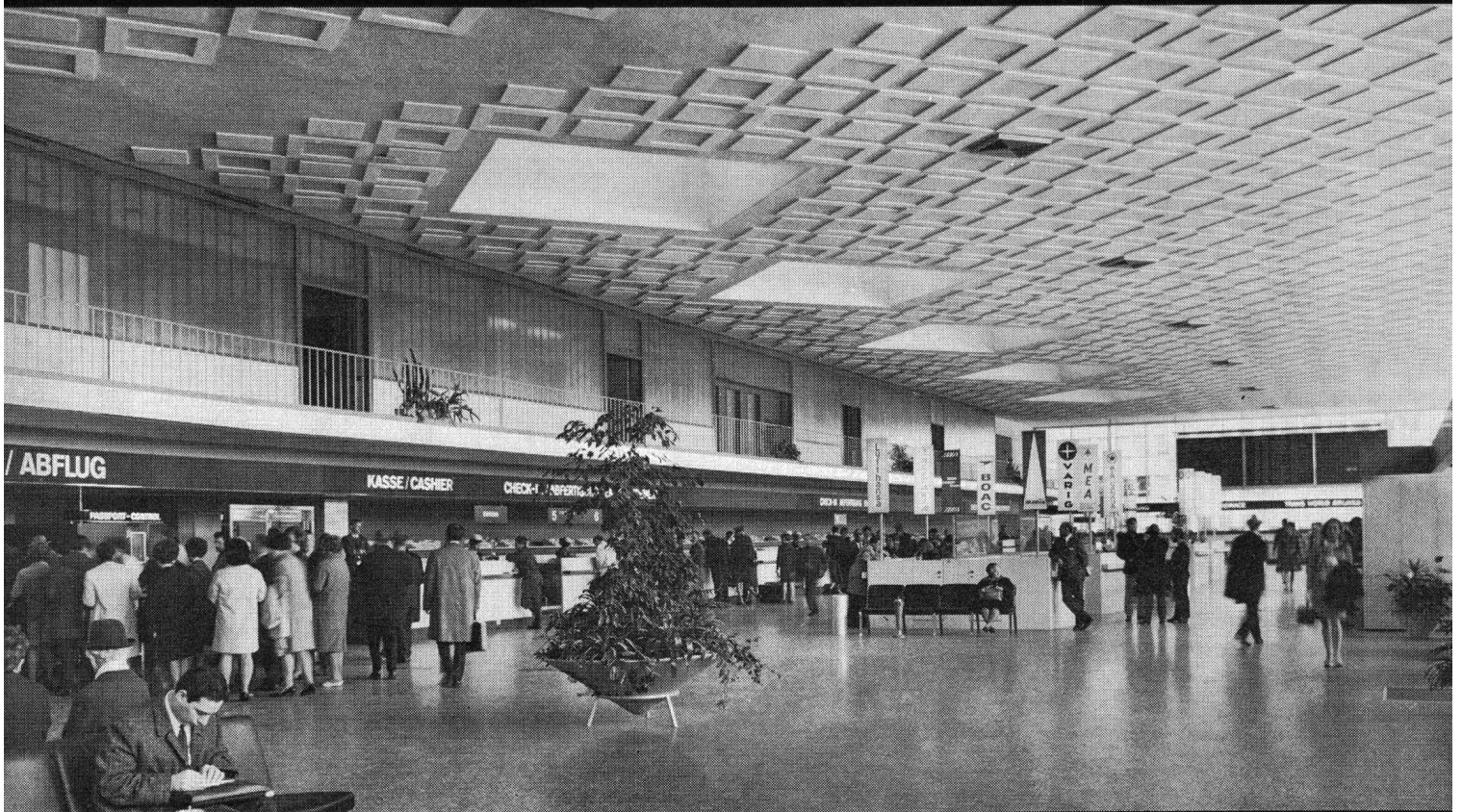
Flughafen Zürich Abflughalle Trakt Nord Bauleitung: Flughafen-Immobilien-Gesellschaft, Zürich