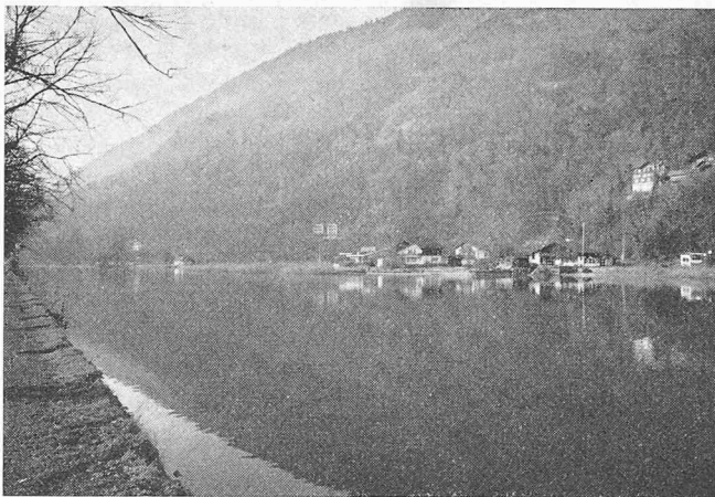
Photogrammetrische Geländeaufnahme mit Passpunkten