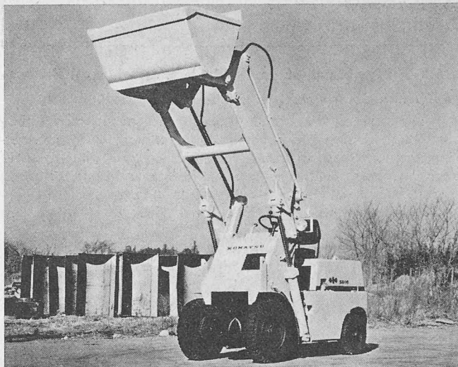
Frontgetriebener Radlader Komatsu SD 10

Den kleineren Typ gibt es in zwei Versionen. Der SD 10-3 wird von einem wassergekühlten Vierzylinder-Dieselmotor Isuzu C 221 angetrieben, der bei 2700 U/min 44 PS leistet. Mit einem 46,5 PS starken Benzinmotor Isuzu G 201 gibt es den gleichen