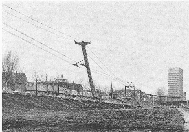
Bild 1. In Bildmitte ist eine typische Stütze der ersten Teilstrecke sichtbar. Sie bestehen im Prinzip aus einem schiefen Dreiein, von dem die zwei Beine rechts als Abspannseile ausgebildet sind. Um den betrieblichen Seilbewegungen Rechnung zu tragen, sind die 4 Seilstränge längsverschieblich an der Stütze befestigt. Rechts im Bild ist die Abspannstelle mit dem Kurvenbauwerk sichtbar. Nach rechts überquert das Trasse den Neckar

1) «Statische Berechnung eines Seiltragwerkes für Hängebahnen», SBZ 90 (1972), Heft 38, S. 919-929.