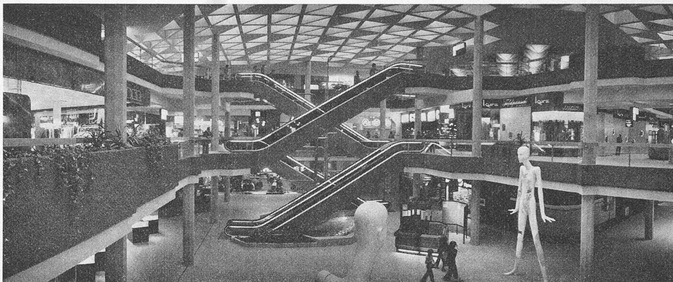
Blick in die Haupt-Mall mit Rolltreppenanlage

Im weiteren wird die Feuerwehr durch Blinksignale, die an den Aussenfassaden montiert sind, über die Stelle des Brandherdes orientiert. In Abhängigkeit der Brandmelder werden die entsprechenden Lüftungs- und Klimaanlage abgeschaltet. Die Abluftventilatoren können von Hand für den Rauchabzug in Betrieb gesetzt werden.