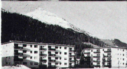
Überbauung Rietstrasse, Elektrizitätswerk der Landschaft Davos; total 33 Wohnungen; Anschlusswert ca. 400 kW