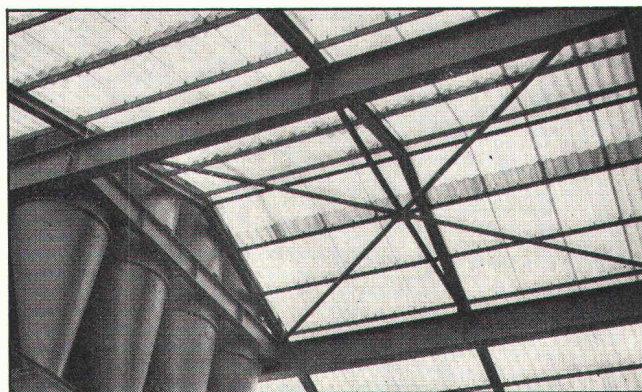
Neomat-Lichtdach auf einer Siloanlage