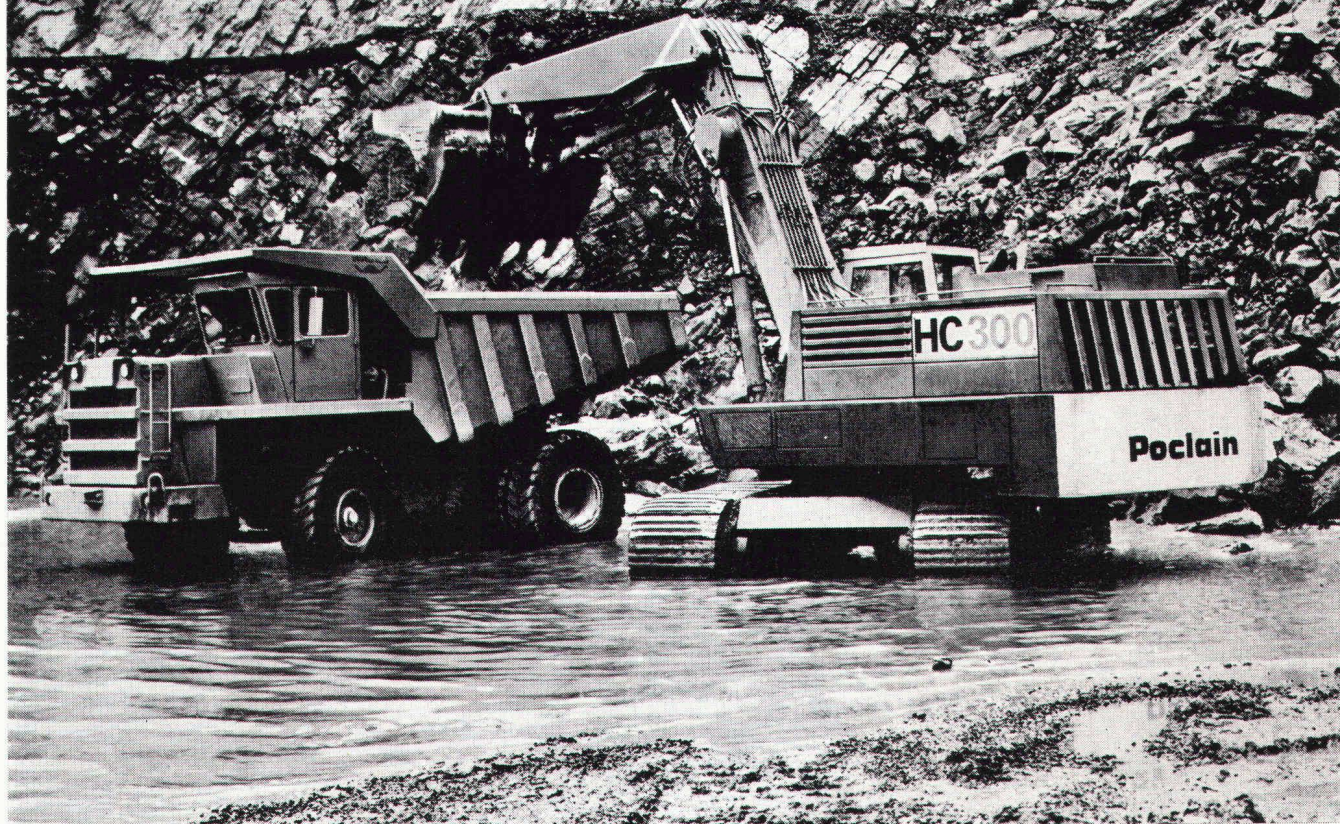
POCLAIN Hydrobagger Mod. HC 300 und WABCO Muldenkipper «Haulpak» mit 35 t Nutzlast

POCLAIN baut 18 verschiedene Hydrobagger, darunter vier ausgesprochene Hochleistungs-Raupenbagger für die wirtschaftliche Bewältigung grosser Bauvolumen.