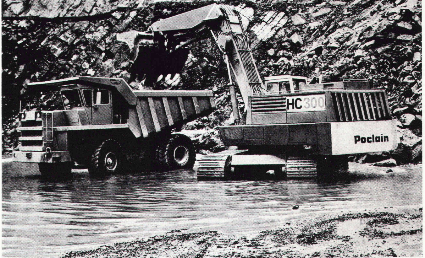
POCLAIN Hydrobagger Mod. HC 300 und WABCO Muldenkipper «Haulpak» mit 35 t Nutzlast

POCLAIN baut 18 verschiedene Hydrobagger, darunter vier ausgesprochene Hochleistungs-Raupenbagger für die wirtschaftliche Bewältigung grosser Bauvolumen.