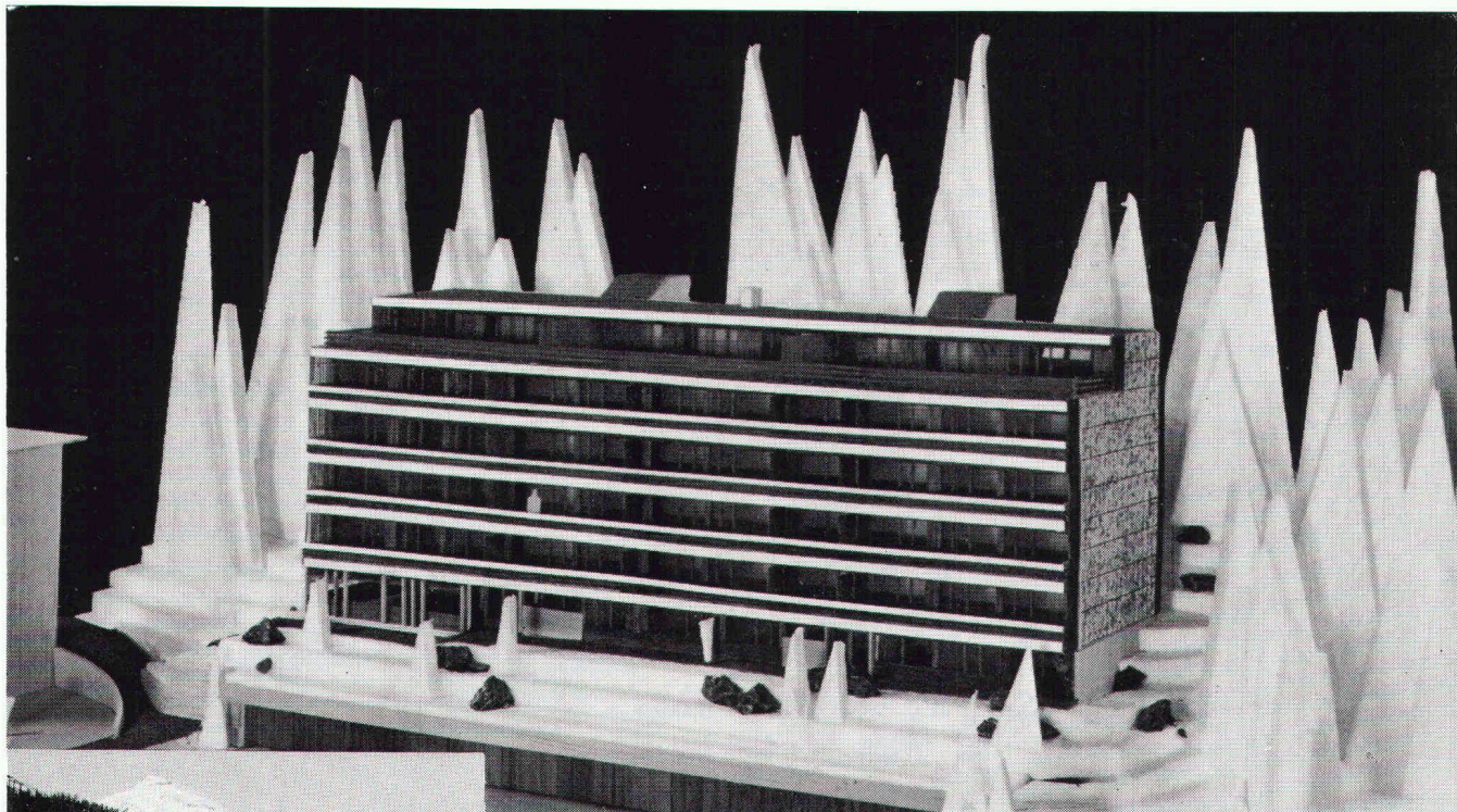
Überbauung Meiliboda 2, Elektrizitätswerk Arosa; total 30 Wohnungen; Anschlusswert ca. 380 kW

Verlags-AG der akademischen technischen Vereine, Zürich