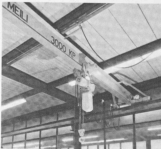
Elektro-Laufkran in Obergurt-Ausführung (auch als Untergurt-Ausführung erhältlich)