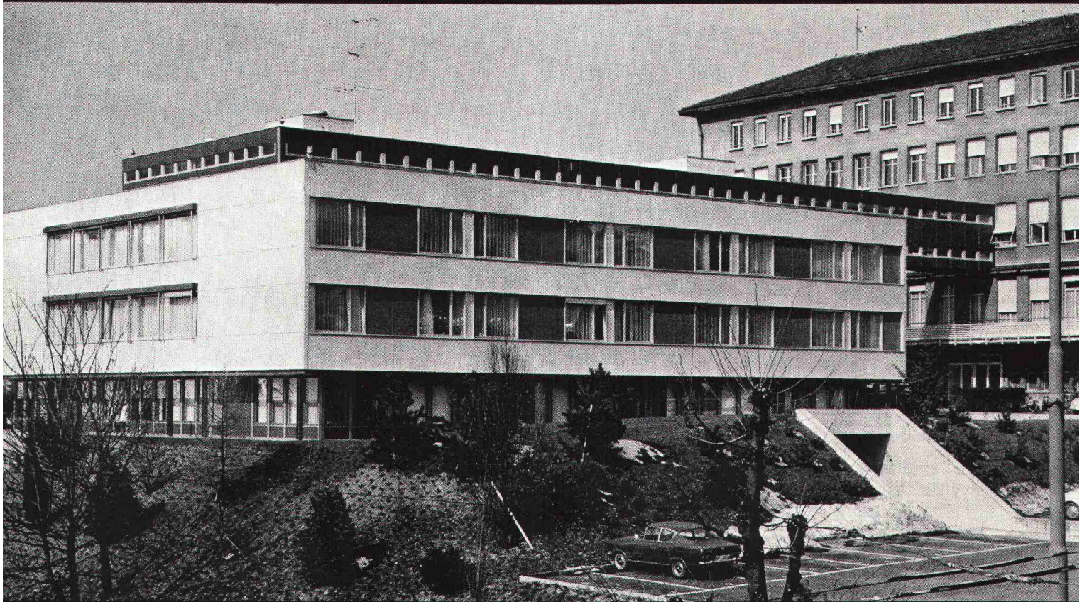
Kantonsspital Lausanne Anbau Chirurgietrakt Architekten: HH. P. Bonnard, J.P. Cahen, J. Lonchamp, Lausanne