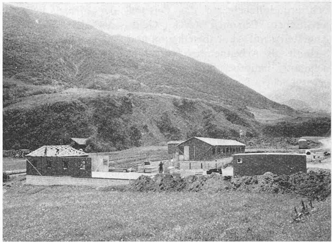
Erstellen von Werk- und Unterkuftsbaracken am südlichen Dorfausgang von Realp unterhalb der ansteigenden Furkapass-Strasse.

Mit dem Baubeginn des Furka-Basistunnels ist ein weiteres Alpentunnelprojekt in Angriff genommen worden. Der nach der Fertigstellung 15,4 km lange Tunnel führt von Realp (Kanton Uri) nach Oberwald (Kanton Wallis) und garantiert der Furka-Oberalp-Bahn eine wintersichere Verbindung. Bisher war der Bahnverkehr von Anfang Oktober bis Ende Mai jedes Jahr unterbrochen. Die zukünftige ganzjährige Verbindung ist deshalb für die Kantone Uri, Graubünden und Wallis von grosser touristischer und volkswirtschaftlicher Tragweite. Der Eisenbahntunnel wird mit zwei Kreuzungsstellen und einem Baustollen vom Bedretto-tal her zur Tunnelmitte gebaut. Dieser erleichtert und ver-