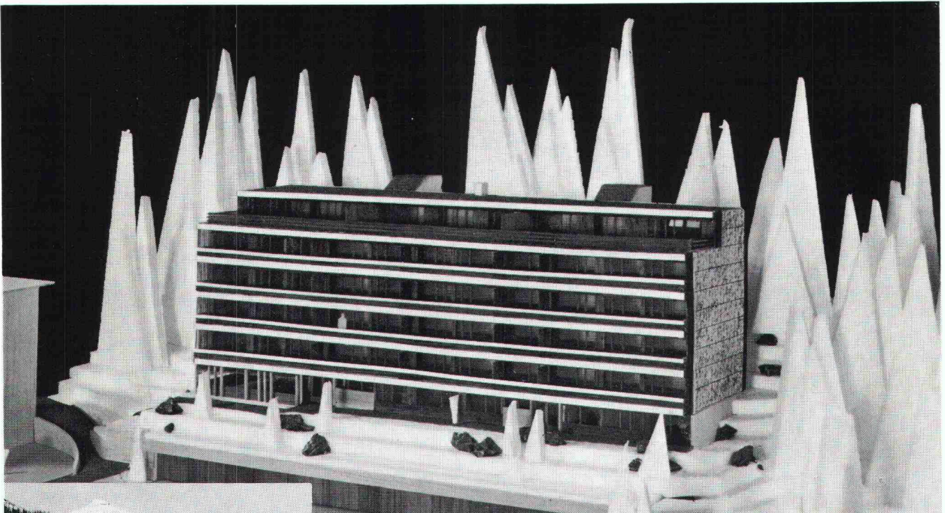
Überbauung Meiliboda 2, Elektrizitätswerk Arosa; total 30 Wohnungen; Anschlusswert ca. 380 kW

Herausgegeben von der Verlags-AG der akademischen technischen Vereine, Zürich