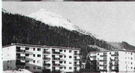
Überbauung Rietstrasse, Elektrizitätswerk der Landschaft Davos; total 33 Wohnungen; Anschlusswert ca. 400 kW

Star Unity AG Fabrik elektrischer Apparate Zürich, in Au/ZH Tel. 01 75 04 04