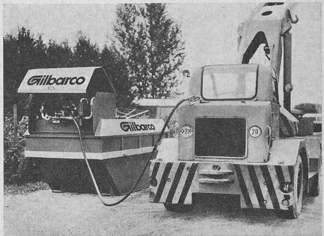
Transportable Tankanlage für Diesel- und Heizöl

Die nach neuesten Erkenntnissen und Vorschriften des Eidg. Amtes für Gewässerschutz gebaute transportable Gilbarco-Tankanlage (System Systa) schafft hier Abhilfe. Bei diesem Tanksystem sind der Öltank (in den Grössen 1500 l, 3000 l, 6000 l, 9000 l und 12 000 l Inhalt), die Pumpenanlage und sämtliche Armaturen in einer genormten Welaki-Transportmulde eingebaut. Dies ermöglicht eine rasche und kostensparende Verschiebung der kompakten Tankanlage. Zudem bietet dieses neue Tanksystem durch eine Auffangwanne, welche 110 % des Tank-