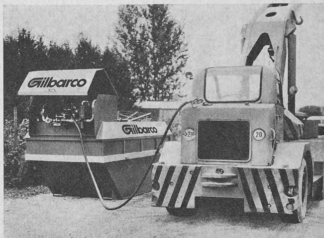
Transportable Tankanlage für Diesel- und Heizöl

Die nach neuesten Erkenntnissen und Vorschriften des Eidg. Amtes für Gewässerschutz gebaute transportable Gilbarco-Tankanlage (System Systa) schafft hier Abhilfe. Bei diesem Tanksystem sind der Öltank (in den Grössen 1500 l, 3000 l, 6000 l, 9000 l und 12 000 l Inhalt), die Pumpenanlage und sämtliche Armaturen in einer genormten Welaki-Transportmulde eingebaut. Dies ermöglicht eine rasche und kostensparende Verschiebung der kompakten Tankanlage. Zudem bietet dieses neue Tanksystem durch eine Auffangwanne, welche 110 % des Tank-