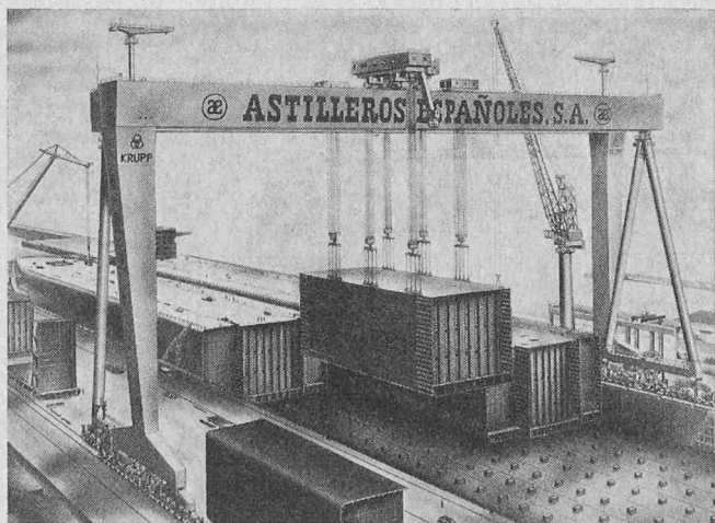
Die beiden 630-t-Bockkrane auf den seitlich versetzten Kranschielen heben gemeinsam Grosslasten bis 1200 t Einzelgewicht für den Bau von Riesenschiffen

Krupp Industrie- und Stahlbau, Wilhelmshaven