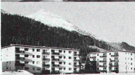
Überbauung Rietstrasse, Elektrizitätswerk der Landschaft Davos; total 33 Wohnungen; Anschlusswert ca. 400 kW

Star Unity AG Fabrik elektrischer Apparate Zürich, in Au/ZH Tel. 01 75 04 04