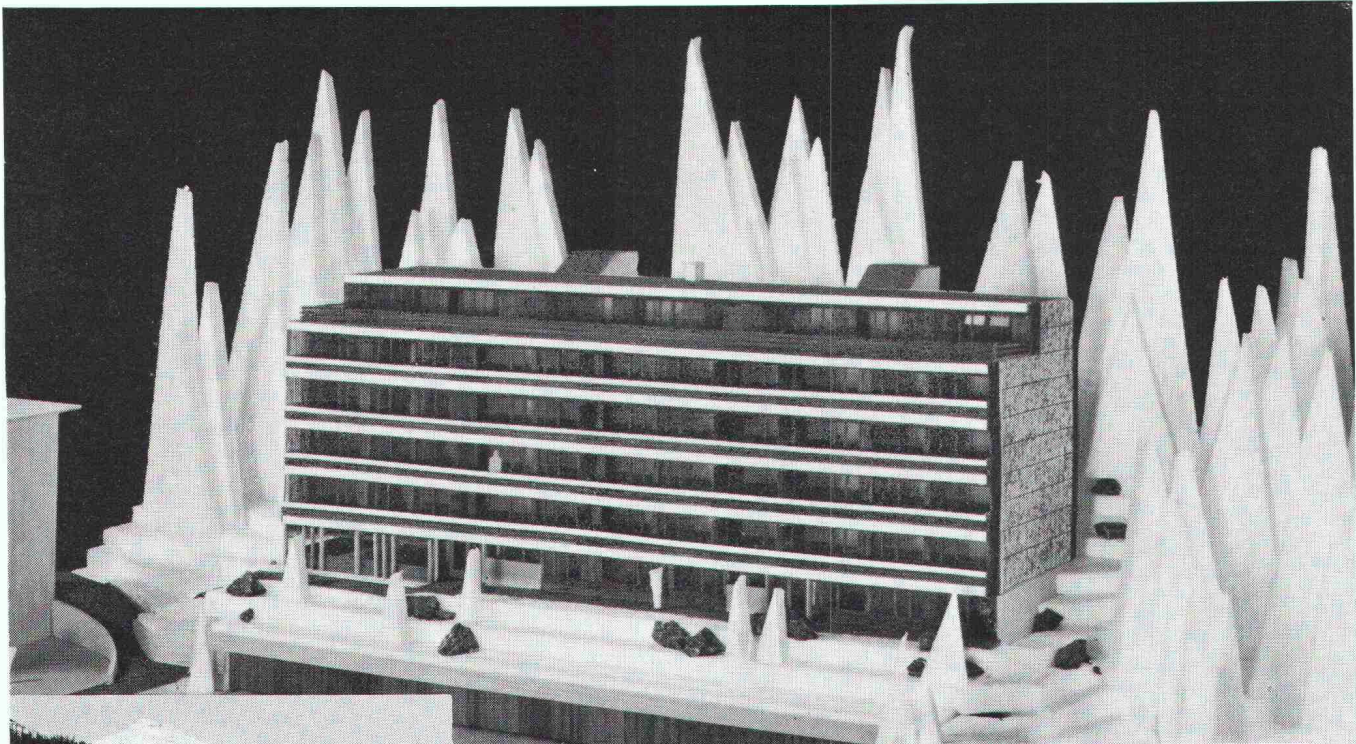
Überbauung Meiliboda 2, Elektrizitätswerk Arosa; total 30 Wohnungen; Anschlusswert ca. 380 kW

Herausgegeben von der Verlags-AG der akademischen technischen Vereine, Zürich