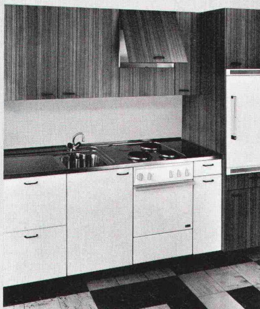
Das ist eine Wernle-Küche. Zum Beispiel.

Bitte ausfüllen und einsenden an: J. Wernle AG, Kirchbergstrasse 1030, 5024 Küttigen/Aarau. Danke.