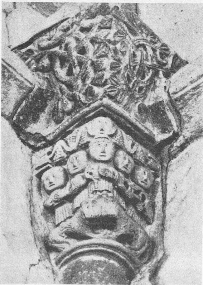
Payerne: Eines der Chorkapitelle (St. Benedict). Kämpfer mit pflanzlichen Motiven

umgangskapitellen von Cluny III – Meisterwerke ihrer Zeit, die stark beschädigt im dortigen Museum erhalten geblieben, aber in Payerne unglaublich roh ausgeführt sind, was in der Nachfolge von Cluny für eine so bedeutende Prioratskirche unvorstellbar wäre. Die Theorie, sie seien nach Maquetten jener Kapitelle, also etwa parallel zu diesen, ausgeführt, hilft auch nicht weiter – und in welchem Material und in welchem Massstab hätte man sich diese Maquetten vorzustellen? Ein Teil der Kapitellplastik scheint für eine der nicht ausgeführten Planvarianten bestimmt gewesen und dann in die endgültige übernommen worden zu sein. Gerne hätte man ein Wort über das seltsame Nebeneinandervorkommen des altertümlichen Bogenfrieses und des westromanischen Konsolengesimses am Äusseren der Hauptapsis gehört, für das der kleinere Schwesterbau von Cluny III, das burgundische Paray-le-Monial, eine (nicht ganz genaue) Parallele bietet. Zum Schluss wird das Verhältnis von Romainmôtier und Payerne zu den anderen, nur als Fragmente erhaltenen Cluniazenserbauten der Westschweiz klargestellt, zu Rüeggisberg, Rougemont, Saint-Sulpice und Münchwiler.