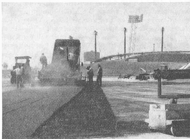
Olympiasee, München. Einbau des Asphaltes mit einem Fertiger über dem verlegten Structofors-Gewebe

† Paola Mariotta , dipl. Architekt SIA/BSA, von Muraltto, ETH 1926 bis 1929, GEP-Kollege, ist kürzlich verstorben. Der Verstorbene war Inhaber eines Architekturbüros in Locarno.