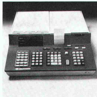
Tischrechner Modell 9810A mit 2036 Programmschritten, 111 Datenspeichern und exklusivem Textausdruck auf dem Streifen-drucker.