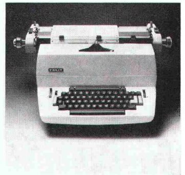
Ausgabe-Schreibmaschine Modell 9861A für die programmierte Ausgabe von Resultaten in Tabellenform.

Dieser einzigartige Tischrechner ist jederzeit und sofort zur Arbeits- und Datenaufnahme bereit. Wann und wo immer Sie ihn brauchen. Sie sind also unabhängig und können unvermeidbare Wartefristen von Servicebüros überbrücken.