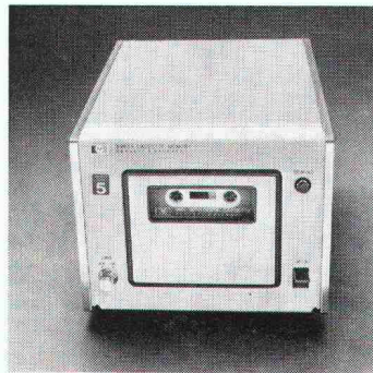
Magnetbandkassette Modell 9865A. Mit diesem preiswerten Massenspeicher lassen sich bis zu 48000 Programmschritte oder 6000 Daten verarbeiten.