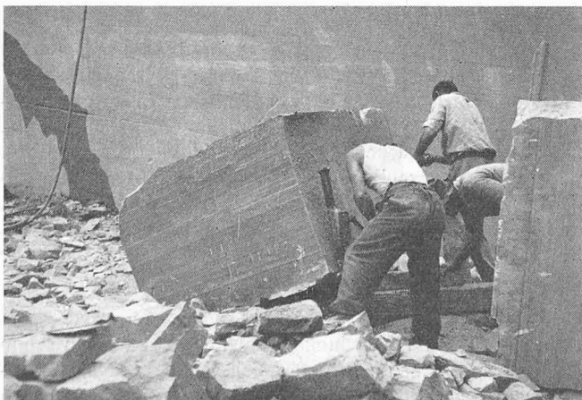
Bild 3. ... und dort sind drei Handlanger nötig, um den Block mit Fusswinden mühsam weiter zu bewegen

Platten ist die Waage fast im Gleichgewicht; sind doch solche mit geschroteten oder gespitzten Kanten noch eine Idee billiger als die maschinengefügten. Nächstes Jahr wird es wohl umgekehrt sein.