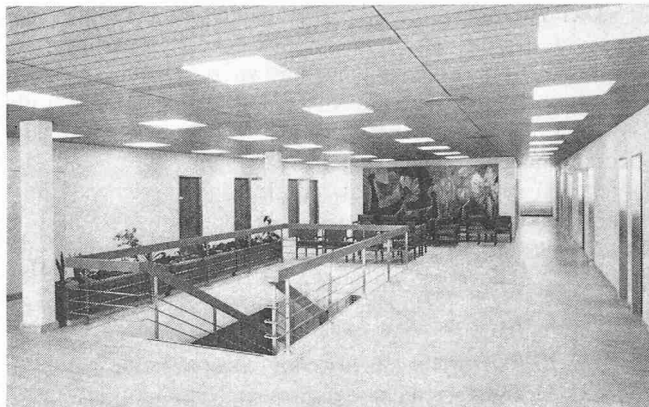
Wartehalle im Obergeschoss des Untersuchungstraktes. Rechts Röntgenabteilung, links die Zimmer der beiden Chefärzte, je mit Untersuchung und Sekretariat (Wandbild: Frl. A. Ruppner)