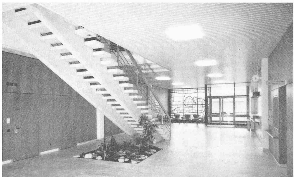
Eingangshalle mit Treppe zum Untersuchungsgeschoss (Glasfenster von G. Tritten )

Im Spätherbst und Winter 1968 wurden Vorarbeiten durchgeführt, im wesentlichen die Zufahrt und die Hauptkanalisation sowie die Änderungen am alten Spital, die