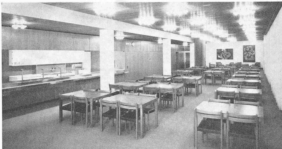
Personal-Essraum, links Selbstbedienungsbuffet

dadurch bedingt waren, dass der Neubau mit nur 1.80 m Abstand hinter dem alten Spital erstellt werden musste, während in diesem der Betrieb ohne Einschränkung weiterging.