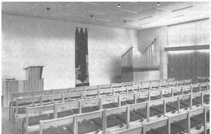
Inneres der Abdankungskapelle