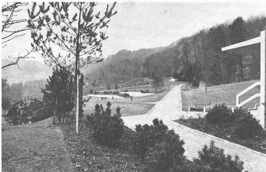
Blick vom erhöht gelegenen Friedhofgebäude gegen Süden mit dem Haupteintrittsweg