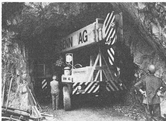
Bild 1 (links). Etwa 2 km von der Ortschaft Seelisberg muss im Rahmen der Gesamtsanierung der Staatsstrasse Beckenried—Emmetten—Seelisberg eine Brücke erstellt werden. Sie ersetzt einen schmalen Strassenabschnitt, der durch einen enggekrümmten Tunnel führte. Wenige Meter vor dem durchfahrenen Felskopf sind bereits die ersten 15 m der neuen Brücke erstellt worden (rechts im Bild), die den Engpass talseitig umfährt