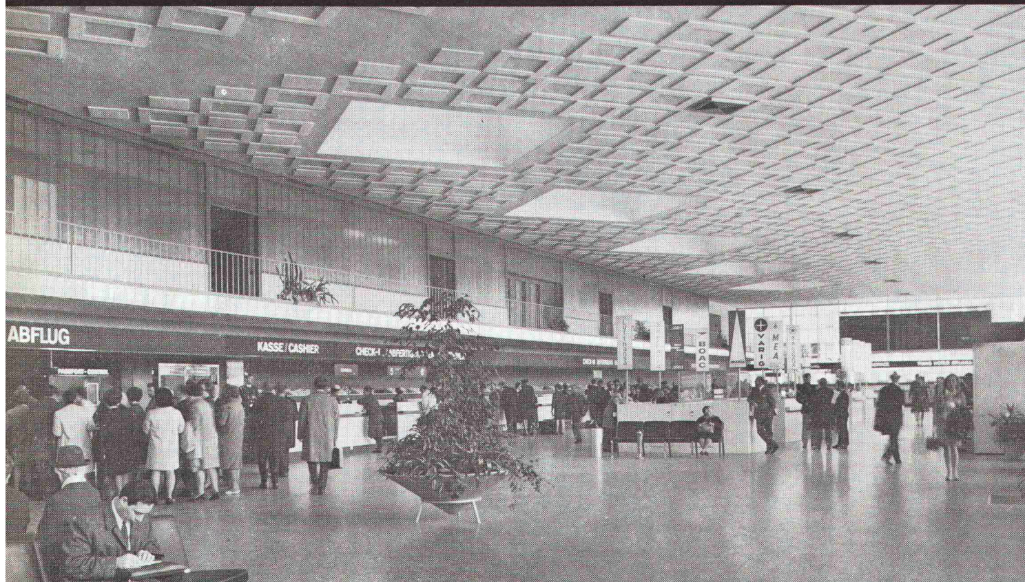
Flughafen Zürich Abflughalle Trakt Nord Bauleitung: Flughafen-Immobilien-Gesellschaft, Zürich