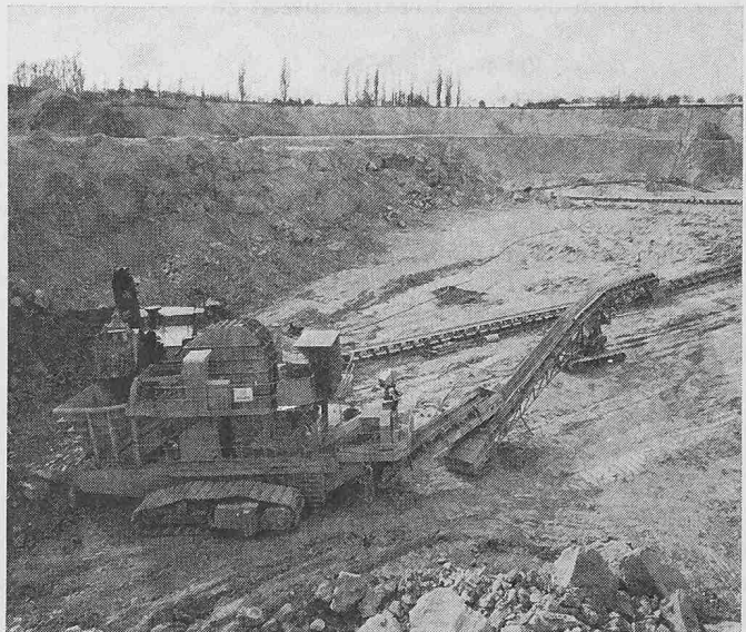
Mobile Brechanlage auf Raupen mit schwenkbarem Abwurfband. Ein Bandwagen auf Raupen stellt die Verbindung zur rückbaren Förderbandstrasse her

Mobile Brechanlage für die Nordcement AG. Für das neue Zementwerk Höver der Nordcement AG, Hannover, wird Krupp Industrie- und Stahlbau eine mobile Brechanlage mit 500 t Stundenleistung liefern (siehe Bild). Sie hat ein Querraupenfahrwerk und vollhydraulischen Antrieb des Aufgabe-Plattenbandes, wiegt insgesamt 360 t und wird im Frühjahr 1972 ihre Arbeit aufnehmen. Bereits 1955 hatte Nordcement gemeinsam mit dem Rheinhausener Konzernunternehmen die Entwicklung auf diesem Gebiet begonnen und damit eine wirtschaftlichere Gewinnung in Tagebaubetrieben von Zementwerken eingeleitet. Ergebnis dieser Bemühungen war die 1956 im Werk Alemania, Höver, als erste in der Welt in Betrieb genommene mobile Brechanlage, der 1962 und 1963 zwei weitere Anlagen folgten. DK 666.94.002.2