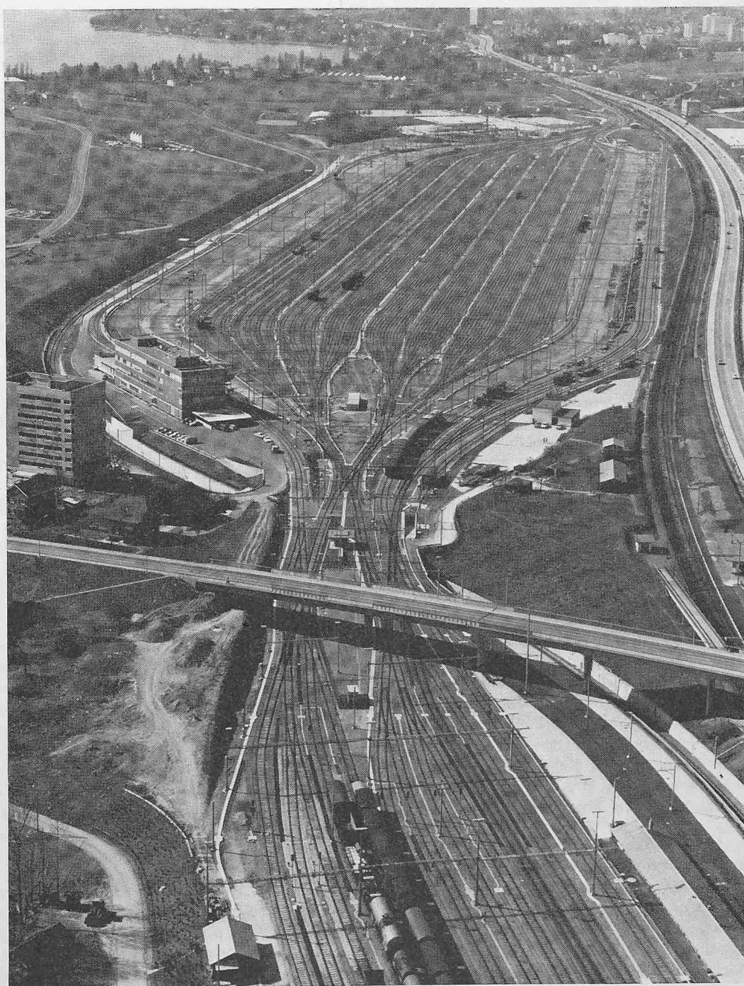
Bild 1. Fliegeraufnahme von Lausanne-Triage, bestehend aus Einfahrgruppe, Ablaufberg und Richtungsfächer; rechts Autobahn und SBB-Linie Lausanne—Genf; links Rückfahrgeleise nach Lausanne, Dienstgebäude mit Funkantenne und Personalwohnhaus; hinten Mitte Werkstatt im Rohbau

Der Personalbestand bei Vollbetrieb wird einschliesslich Werkstätte 180 Mann betragen; er wird sich jedoch nach der Vollautomatisierung vermindern. Ähnliche Rangierbahnhöfe wie Lausanne-Triage, die heute schon im Bau stehen, sind Muttentz II (Eröffnung 1974) und Limmattal (Eröffnung 1976).