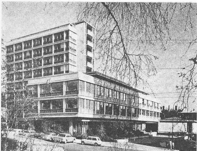
Das Zahnärztliche Institut der Universität Zürich an der Plattenstrasse (1957 bis 1961) von Westen

Die Bauten im Spitalareal umfassten zusammen 325 000 m 3 . Ihr Kostenanteil betrug einschliesslich betriebsfertiger Einrichtung und Mobiliar ohne Abzug von Subventionsbeiträgen rund 85 Mio Fr., so dass sich der durchschnittliche Kubikmeterpreis auf 260 Fr. stellte. Beim Zahnärztlichen Institut lauten die entsprechenden Zahlen 15 Mio Fr., 47 850 m 3 , 313 Fr./m 3 . Noch während der Fertigstellungsarbeiten setzten dort unvorhergesehene Entwicklungen ein, die innert vier Jahren nach Bezug Ergänzungen an der Ausstattung im Betrag von gut einer Million