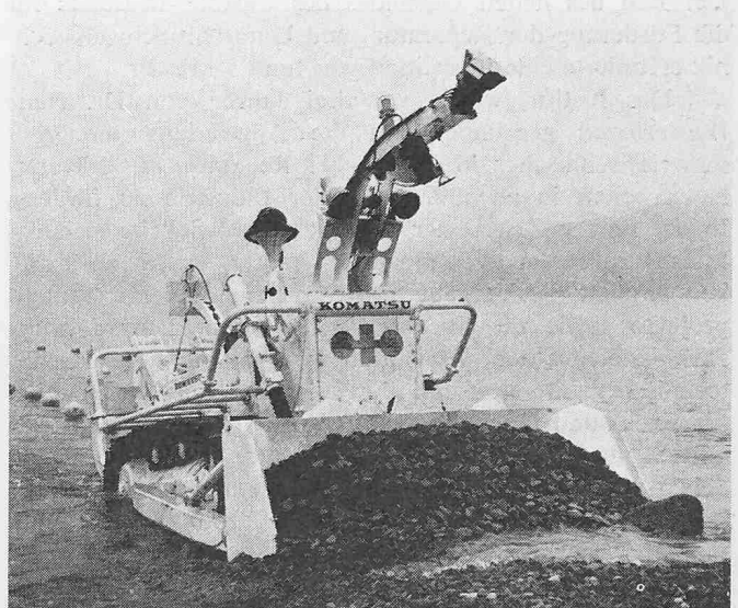
Bild 2. Elektrisch angetriebene Planierraupe für den Unterwassereinsatz

Die Entwicklung von Maschinen, die unter dem Wasserspiegel und in grösseren Tiefen eingesetzt werden können, scheint ein vielversprechendes Gebiet für die Industrie zu sein. Dies trifft besonders bei Ländern zu, die – wie Japan – ausgedehnte Küsten und Mangel an bewohnbarer Landfläche aufweisen. Dies führte Komatsu dazu, eine