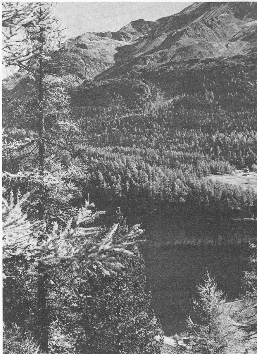
Lärchen und Arven durchsetzen die Waldungen am Silsersee