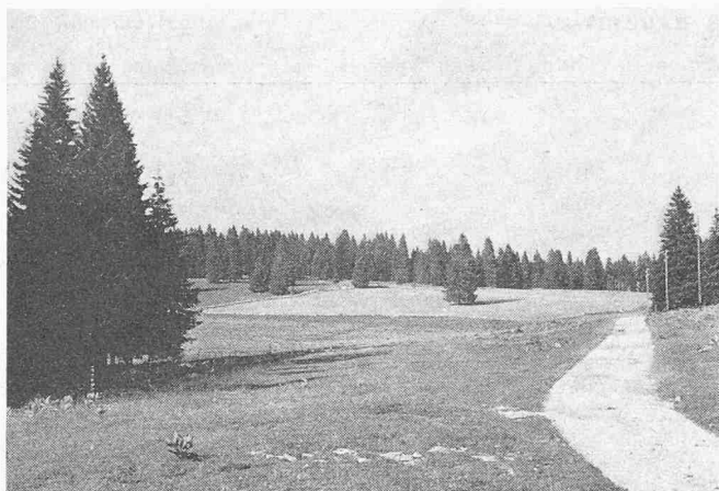
Die parkartige Waldlandschaft im Jura findet steigenden Zuspruch durch Erholungsuchende (Neuenburger Jura)