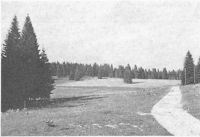
Die parkartige Waldlandschaft im Jura findet steigenden Zuspruch durch Erholungsuchende (Neuenburger Jura)