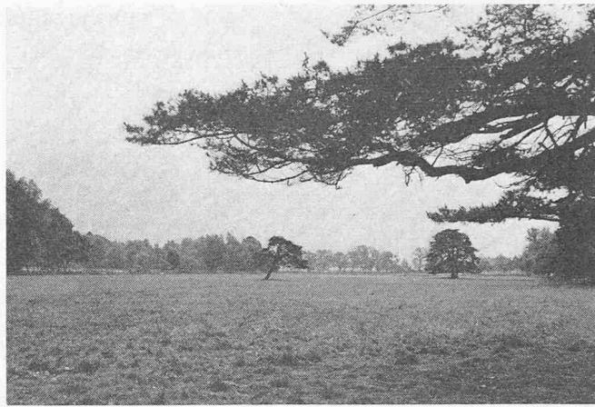
Baum-Charaktere geben in der Bündner Herrschaft die räumliche Tiefe