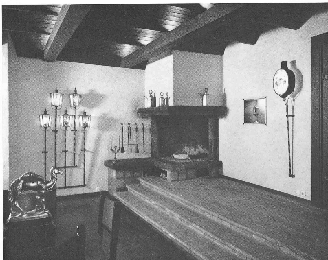
Cheminée an der Eingangsseite