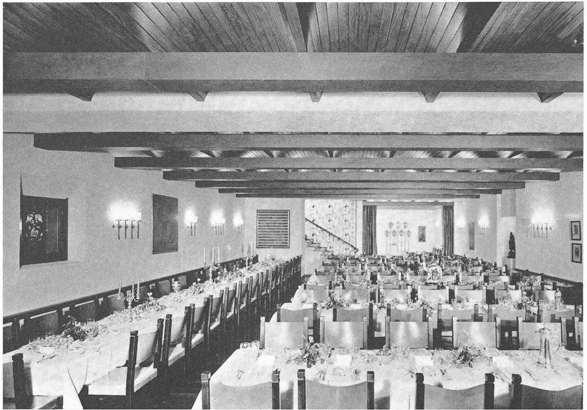
Die festlich gedeckten Tafeln im Zunftsaal