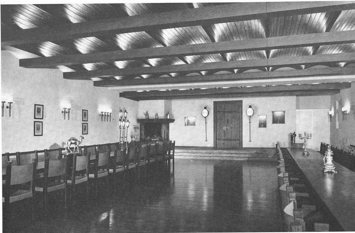
Die Eingangsseite des Zunftsaals