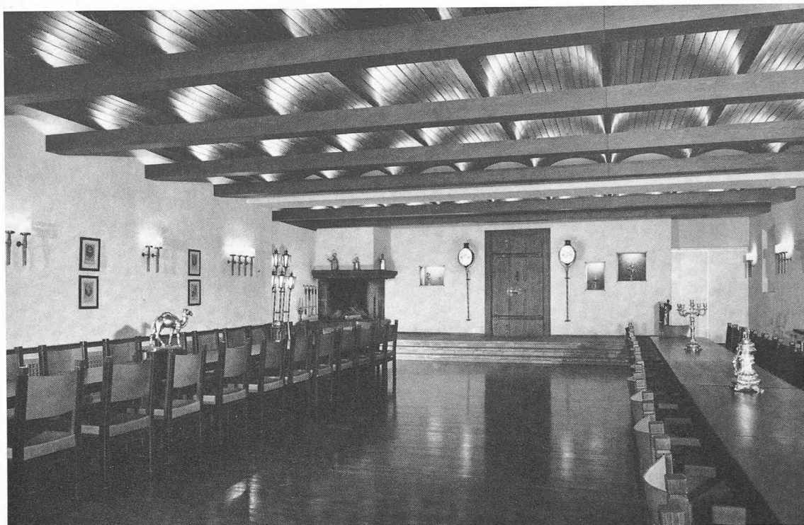
Die Eingangsseite des Zunftsaals