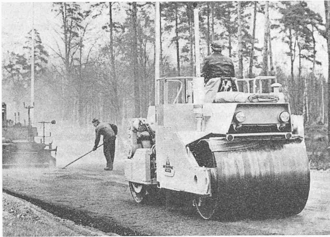
Bild 1. Die Vibrationswalze Dynapac CC-40 der AB Vibro Verken im Einsatz

Das ständige Ansteigen der Verkehrsdichte, der Geschwindigkeit und des Gewichtes der Verkehrsmittel stellt grosse Anforderungen an den Bau von Strassen, Flugplätzen usw. Die Vergebung von längeren und grösseren Baulosen gestattet den wirtschaftlichen Einsatz von grossen und leistungsfähigen Strassenanfertigern.