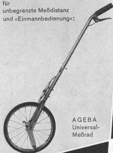
AGEBA Universal- Meßrad

für unbegrenzte Meßdistanz und «Einmannbedienung»: