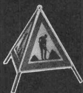
Gefahren-Faltsignale aus wetterbeständigem Plastic-Gewebe

Die Namensliste der gebräuchlichen Messgeräte würde dieses Inserat überfüllen. So zeigen wir hier nur einen Querschnitt davon.